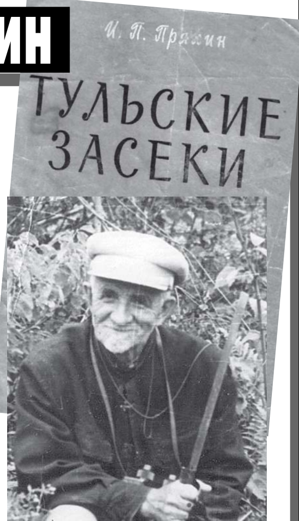
9 апреля 1937 года

Снег весь стаял. Воды спали. Полог неба голубой. Поле дышит, зеленеет. Крики чаек над рекой. Как могучий витязь вольный, лес проснулся и шумит, А с небес, всем улыбаясь, солнце ясное блестит. Пар струится над полями, пахнет сыростью в лесу, И травинки, как булавки, вылезают на лугу. Прошлогодний лист дубовый чуть-чуть плесенью покрыт, Голубой подснежник нежный из земли сырой глядит. Вся усыпана барашком, ива смотрится в ручей, Что в моря пересылает воды светлые ключей. Он смешал те светлы воды с мутью таявших снегов И хмельной, гулливый, полный рвется вон из берегов. Куст орешника наряжен бурой нежною серьгой, И стволы березы полны соком – сладостным вином. Раньше всех набухли почки у нескромной бузины, А за ней кусты черемух, вешним трепетом полны. И осин вершины, ветви, и колонны тополей Закудрявились цветами в брачной радости своей. Уж грачи сидят на гнездах, жаворонки трели льют, И скворцы скворечни чистят, песнь весеннюю поют. Слышно утром на опушке воркованье голубиц, В лесе темном у полянок – ликованье певчих птиц. Сядь на пенё со мной мохнатый и прислушайся на миг, Пока хор многоголосый в лесной чаще не затих. Ты услышишь гимн хвалебный, песнь красавице-весне И дыханье жизни вольной в поле, в лесе и в реке.