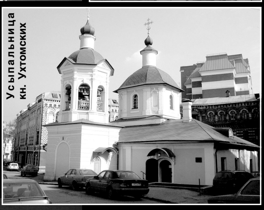
Усыпальница кн. Ухтомских