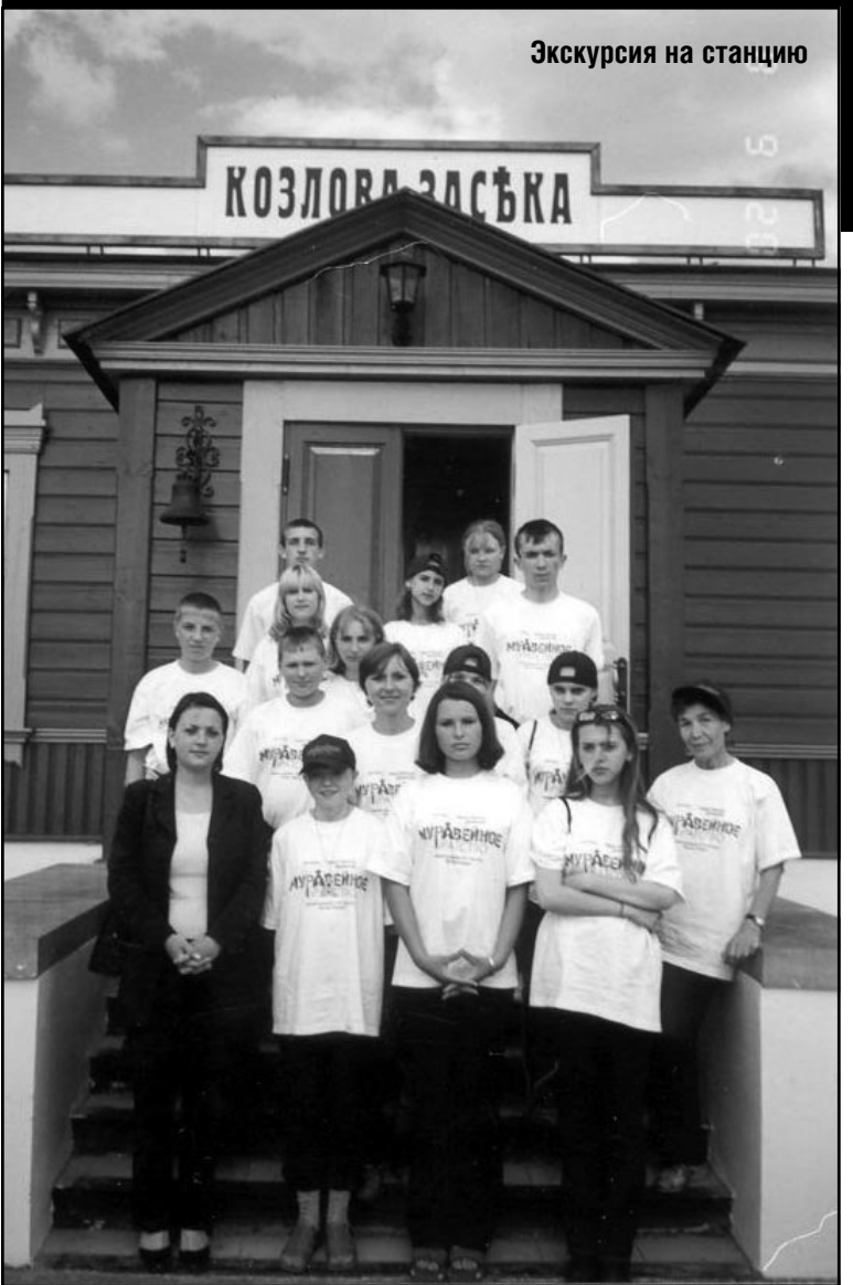
Экскурсия на станцию