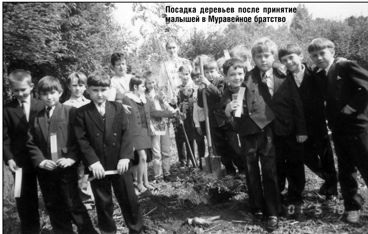
Посадка деревьев после принятия малышей в Муравейное братство

Мало кто теперь в Крапивне держит своих лошадей. Гораздо более удобным подспорьем в хозяйстве стала техническая сила: автомобиль, трактор.