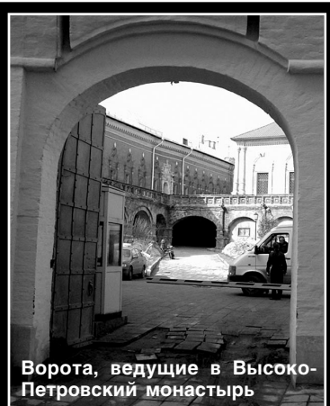
Ворота, ведущие в Высоко-Петровский монастырь