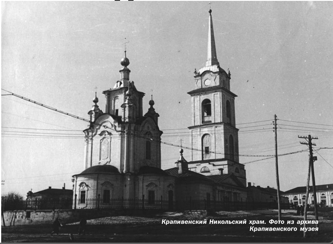
Крапивенский Никольский храм.