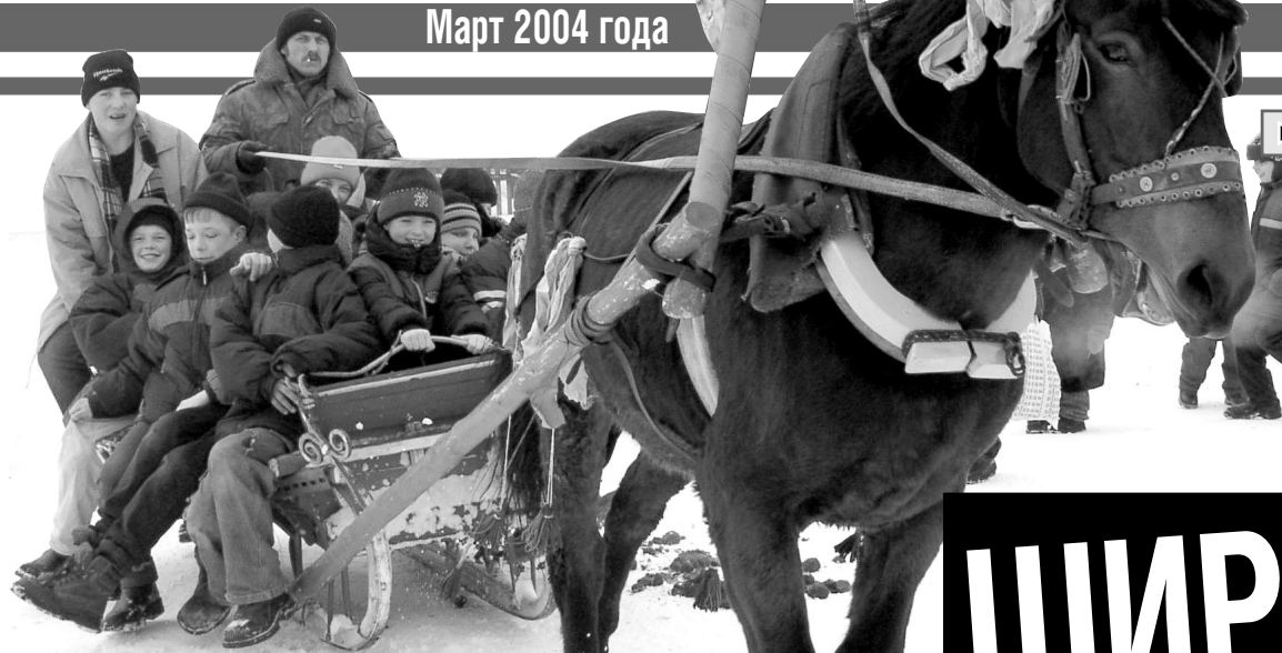
Традиционное катание на лошадях

Масленица потому так названа, что людям в течении этой недели позволялось вкушать коровье масло. В церковных книгах Масленица называлась сырной неделей, на которой в среду и пятницу ели сыр и яйца. Она праздновалась на последней неделе перед Великим постом. Поеть вдоволь и погулять вволю перед строгим семинедельным постом сам Бог велел. Всю неделю устраивались пиры, непременно с блинами и оладьями. Блины как в старые времена, так и сейчас, играли главную роль в праздновании Масленицы. Они служили символом солнца, которое всё ярче разгорается, удлиняя светлое время. Блины пеклись хозяйками на протяжении всего праздника. На блины звали гостей и повсюду угощали. Недаром есть такая поговорка: «Первый блин комом». Его не выбрасывали, а отдавали нищим на поминовение усопших.